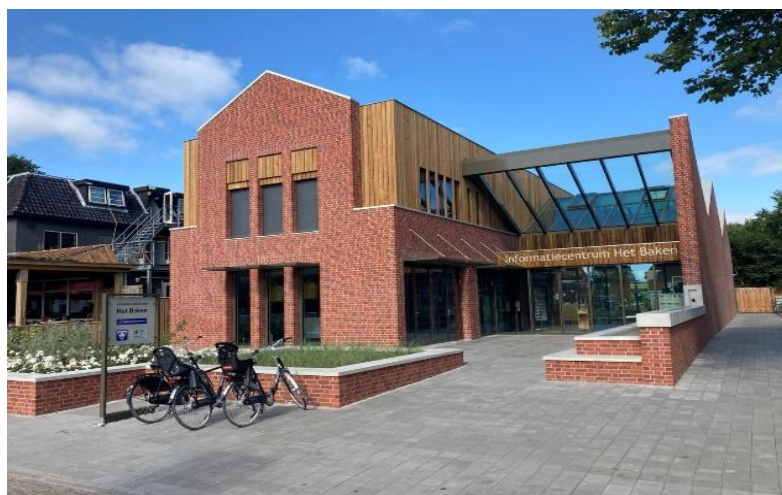
Bezoekerscentrum het Baken